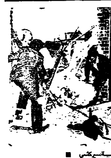
الدمار نتيجة قنبلة محطة سركسي

اعلنت الحكومة امس ان نوار جزر ملقا الجنوبية قد خفوا طلباتهم ، وان البحث يجري في احيال مباحلة رحلتهم الذين يبلغ عددهم ٥٩ شخصا بنوار سجناء يبلغ عددهم ٢١ شخصا . وايضا نوس غير المنطقة بلسان وزارة العدل في مركز الطوارئ هنا المصحين ان الاربعة عشر مسلحا الذين يحتجزون الرهائن في قسار مطوف وفي مدرسة قريبة قد تخلوا عن مخالطة بالسلاح لهم بنقل الرهائن معهم في طائرة خاصة الى خارج هولندا . وقالت ان المسؤولين في مركز الطوارئ يدرسون الآن مع المسلحين كيفية اطلاق سراح الرهائن ، وهم مه رهيبة في النظر وارادة رهائن نسي المدرسة . وبين الاحتمالات التي هي قيد الدرس بمبادرة الرهائن بالسجناء في مطار شيول وهو مطار مدينة استرام . لكن ليسر قلت ان المسلحين لا يزالون يرفضون الاصحاح عن وجهة سفرهم .